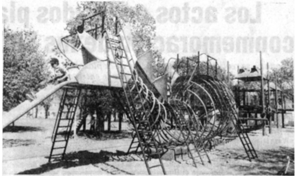
Dos enfoques de la nueva Plaza de Ejercicios "Miguel V. Dávila"

Juegos para todas las edades que estimulan la imaginación y la creatividad.