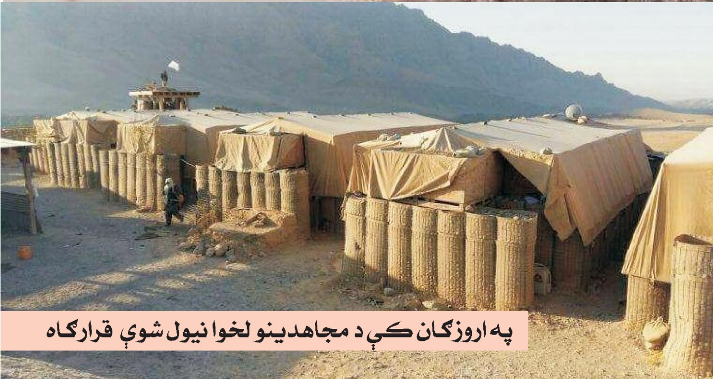
په اروزگان کې د مجاهدينو لخوا نيول شوي قرارگاه