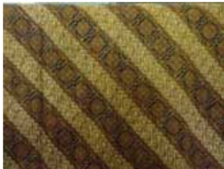
Foto 19. Motif Parang Gandasubrata (Foto Tim, tanggal 17 April 2015)