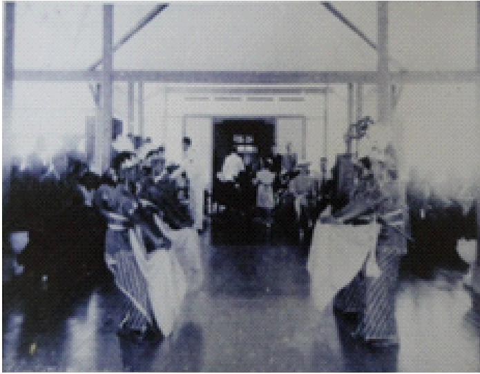
Foto 26. Tarian Jawa Dalam Peresmian Pendapa Si Panji Tahun 1937