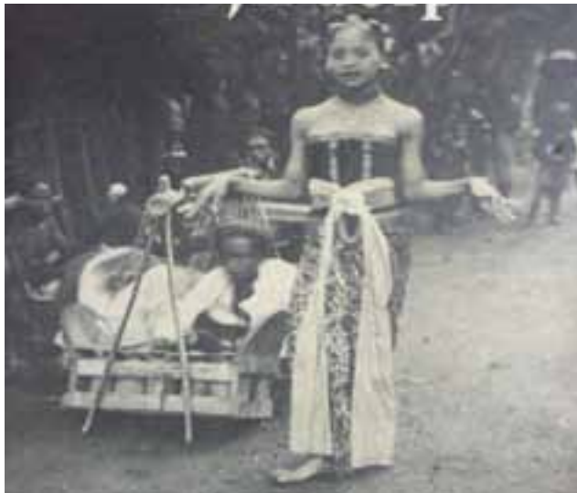
Foto 29. Penari Ronggeng (Repro Cover Novel Ronggeng Dukuh Paruk)

Lengger sebagai sarana hiburan ketika masa Bupati Gandasubrata sudah masuk ke kehidupan bangsawan. Lengger sering ditanggap keluarga Gandasubrata untuk dipentaskan di pendapa kabupaten. Lengger ketika ada perjamuan di pendapa kabupaten dipentaskan