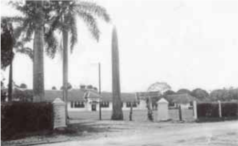
Foto 7. MULO Purwokerto (Sekarang SMAN II Purwokerto)