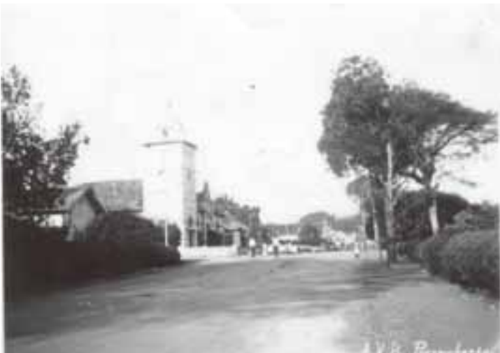
Foto 6. Gedung Algemeene Volks Bank (AVB) Sekarang Museum BRI