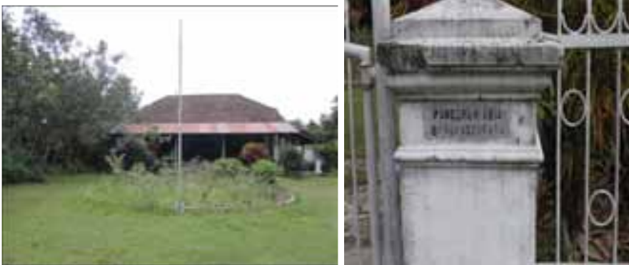
Foto 14. Dalem Pangeranan Masih Terawat Hingga Saat Ini (tanggal 17 April 2015)

Pangeran Adipati Aria Mertadiredja III saat memasuki masa pensiun membangun sebuah rumah di desa Sudagaran, di atas tanah seluas \pm 5000 \text{ m}^2 , tidak jauh dari rumah Bupati Banyumas. Rumah tersebut kerap disebut Dalem Pangeranan atau Pangeranan . Adapun rumah tersebut sekarang beralamat di Jalan Budi Utomo No. 294. Setelah P.A.A Mertadiredja pensiun pada tahun 1913, beliau tinggal di Dalem Pangeranan sampai wafat pada tahun 1927 (Ratmini Gandasubrata, 2011:55).