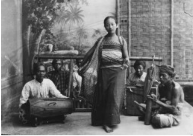
Foto 28. Penari Ronggeng Dengan Iringan gamelan Tahun 1870-1900.