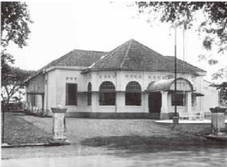
Foto 1. “ Sociteit Slamet ” sekarang Gedung RRI Purwokerto

Kembali membahas tentang gedung pertemuan dan rekreasi milik orang-orang Belanda pada masa itu, bernama “ Sociteit Slamet ”. Gedung tersebut merupakan gedung yang sangat luas. Gedung Sociteit Slamet dibangun antara lain oleh para pemilik perkebunan, administratur pabrik, manager perkeretaapian, yang semuanya berkebangsaan Belanda. Sociteit Slamet diperuntukkan bagi orang-orang Belanda, dengan beberapa pengecualian bagi segelintir kalangan elite pribumi, dan orang Tionghoa yang statusnya tinggi. Pelindung Sociteit Slamet adalah Residen Belanda.