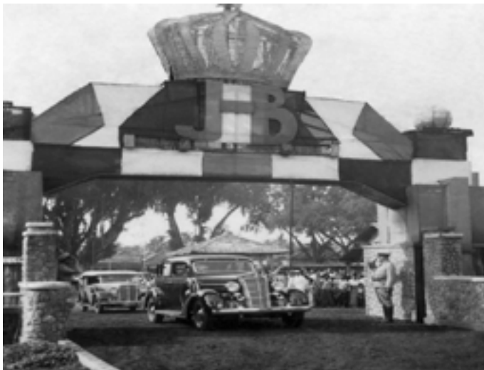
Foto 12. Mobil Bupati Dalam Rangka Peresmian Pendapa Si Panji di Purwokerto

Rumah kabupaten di Purwokerto didirikan oleh almarhum Raden Adipati Aryo Mertadireja II yang juga merupakan leluhur keluarga Gandasubrata. Rumah Kabupaten Purwokerto dibangun sekitar tahun 1850, berarti saat ditempati Bupati Raden Sudjiman, bangunan tersebut berumur kurang lebih 86 tahun. Adapun rumah pendapa Kabupaten Banyumas yang dinamakan Si Panji pada waktu itu telah berumur kurang lebih 250 tahun dan merupakan pusat pemerintahan Kabupaten Banyumas sejak berdirinya Kabupaten Banyumas di jaman Kesultanan Pajang (Purwoto Suhadi Gandasubrata, 2003: 8).