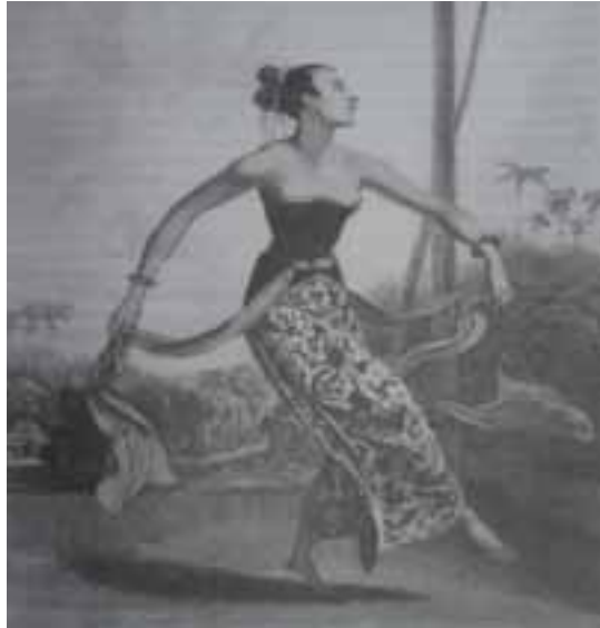
Foto 27. Ronggeng atau Tarian Wanita Menurut Raffles

Namun, lengger tetap dipandang sebagai perempuan yang diberkahi, karena mereka masih sering diminta berkahnya untuk anak-anak kecil (Wawancara dengan Bapak Ahmad Tohari tanggal 15 April 2015 di Banyumas).