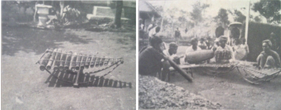
Foto 24. Pertunjukan Calung