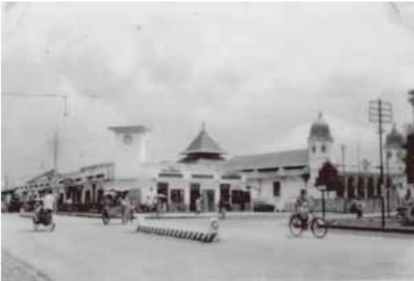
Foto 9. Suasana Jalan dan Pertokoan di Sekitar Pasar Wage

dikembangkan melalui pembangunan pabrik gula, dan membangun kota baru di sebelah barat kota lama sebagai pusat pemerintahan. Hal ini diawali dengan pemindahan kabupaten, kantor dan rumah dinas Asisten Residen dari Ajibarang dan dilanjutkan dengan pemindahan Kabupaten dan Karesidenan dari Banyumas ke Purwokerto (Wawancara dengan Soegeng Wijono, tanggal 15 April 2015 di Banyumas).