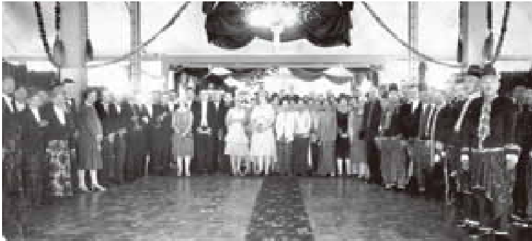
Foto10. Bupati Mancanegara di Pendapa Si Panji Banyumas bersama Istri, Residen, dan Para Dokter Setelah Menghadiri Peresmian RS Joelliana tahun 1925

yang bertemu di puncak yang runcing. Bangunan bentuk tajug dapat dikembangkan dengan berbagai tambahan seperti: Tajug Lawakan , Tajug Lambang Teplok , Tajug Semar Tinandu , Tajug Semar Sinongsong , Tajug Lambangsari , dan Tajug Semar Sinongsong Lambang Gantung . Jenis yang terakhir tersebut merupakan tajug bertiang satu dengan bahu serta memakai lambang gantung. Lambang gantung tersebut sebagai penggantung atap penanggap pada brunjung . Tajug jenis ini dipakai di masjid Saka Tunggal Desa Cikakak Wangon dan Masjid Pakuncen, keduanya di Kabupaten Banyumas.