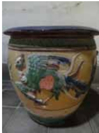
Foto 15. Koleksi Pot Antik Dari Masa Bupati Pangeran Aria Gandasubrata (Foto Tim, tanggal 17 April 2015)

Menurut penuturan Ibu Yetty Gandasubrata, di bagian serambi depan rumah dahulu diisi dengan dua perangkat meja kursi, satu perangkat terdiri atas meja marmer bundar dikelilingi oleh empat