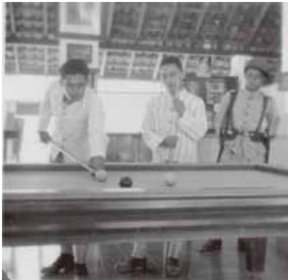
Foto 2. Para Pemuda Sedang Bermain Bilyard

Kaum elit pribumi Purwokerto yang tidak bisa menjadi anggota Sociteit Slamet kemudian mendirikan sociteit atau kamar bola khusus untuk kaum pribumi yang diberi nama “Panti Soemitro”. Bupati Sudjiman Gandasubrata diangkat sebagai pelindung Sociteit Panti Soemitro . “Panti Soemitro” juga menyediakan berbagai macam sarana rekreasi seperti ruang permainan bilyard, ping pong , dan berbagai sarana pertunjukan kesenian Jawa (gamelan, pakaian tari dan pakaian wayang orang). Di samping itu, dibangun juga lapangan tenis untuk kaum pribumi di sudut alun-alun selatan. Keanggotaan Sociteit Panti Sumitro bebas untuk kaum pribumi. Di sinilah kemudian anak-anak kaum pribumi belajar bermain gamelan dan tarian Jawa.