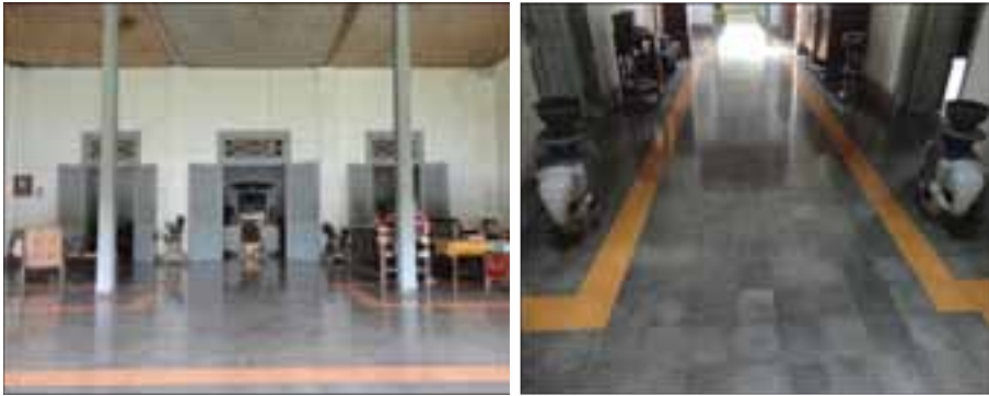
Foto 16. Bagian Depan dan Tengah Dalem Pangeranan

kursi goyang ukiran. Adapun untuk masuk ke dalam rumah, ada tiga buah pintu lebar dan di bagian tengahnya ada ruangan yang menghubungkan serambi muka dengan serambi belakang.