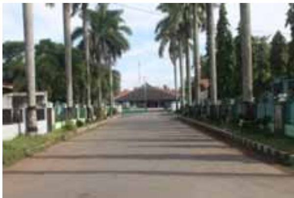
Foto 3. Foto Atas: Jalan Yang Membelah Alun-Alun. Foto Bawah: Jalan Yang Membelah Alun-Alun Sampai Pintu Masuk Rumah Bupati Banyumas.