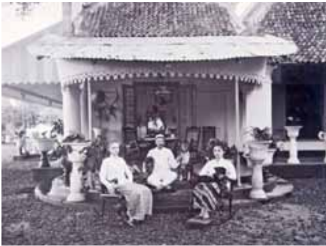
Foto 17. Keluarga Pejabat Pabrik Gula Kalibagor Memakai Batik (Repro Koleksi SoegengWijono)

Peran keluarga bupati juga sangat mendukung untuk perkembangan batik di Banyumas. Batik tetap eksis karena menjadi pakaian yang selalu dikenakan oleh masyarakat pada waktu itu. Batik terutama menjadi pakaian keseharian anggota keluarga Bupati Gandasubrata. Pejabat kolonial Belanda pun senang memakai batik seperti terlihat pada foto berikut ini.