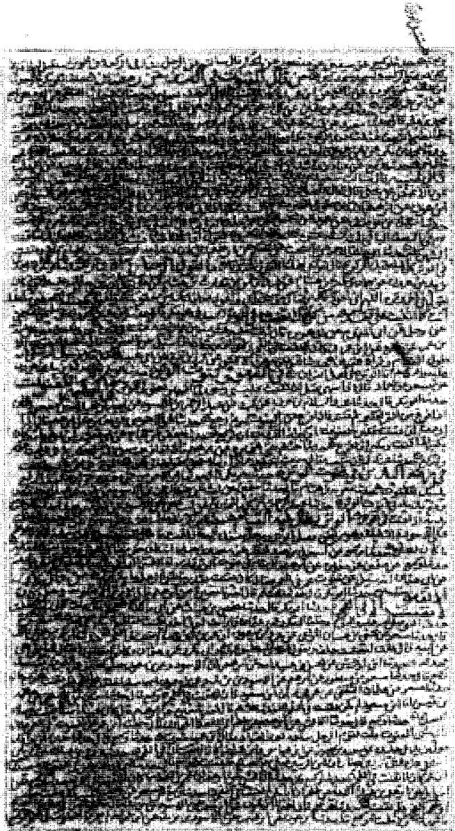
الصفحة الأخيرة من القسم المعتمد في هذا المجلد من نسخة (ع)