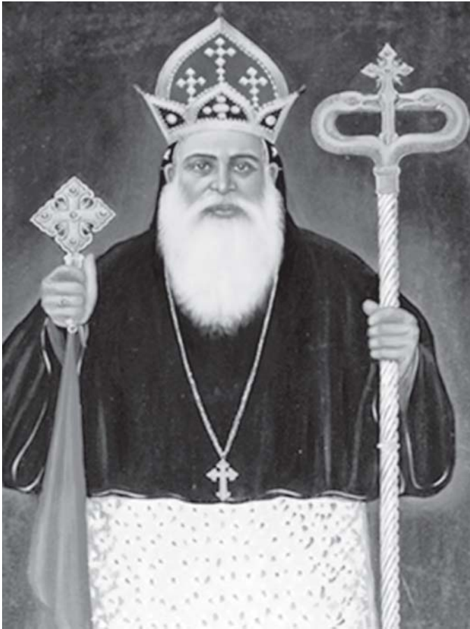
എട്ടാം മാർത്തോമ്മാ മെത്രാൻ

എന്നാൽ മൂന്നാമതൊരു തീയതിയാണ് 'നിരണം ഗ്രന്ഥവരി'യിൽ (എഡിറ്റർ ഡോ. എം. കുര്യൻ തോമസ്, 2000, പേജ് 121) കാണുന്നത്. 991മാണ്ടു ധനുമാസം മുതൽ മർത്തോമ്മാൻ മെത്രാൻ ദീനമായി. പുത്തൻകാവിൽ പാർത്തിട്ടു ഭേദം വരുന്നി