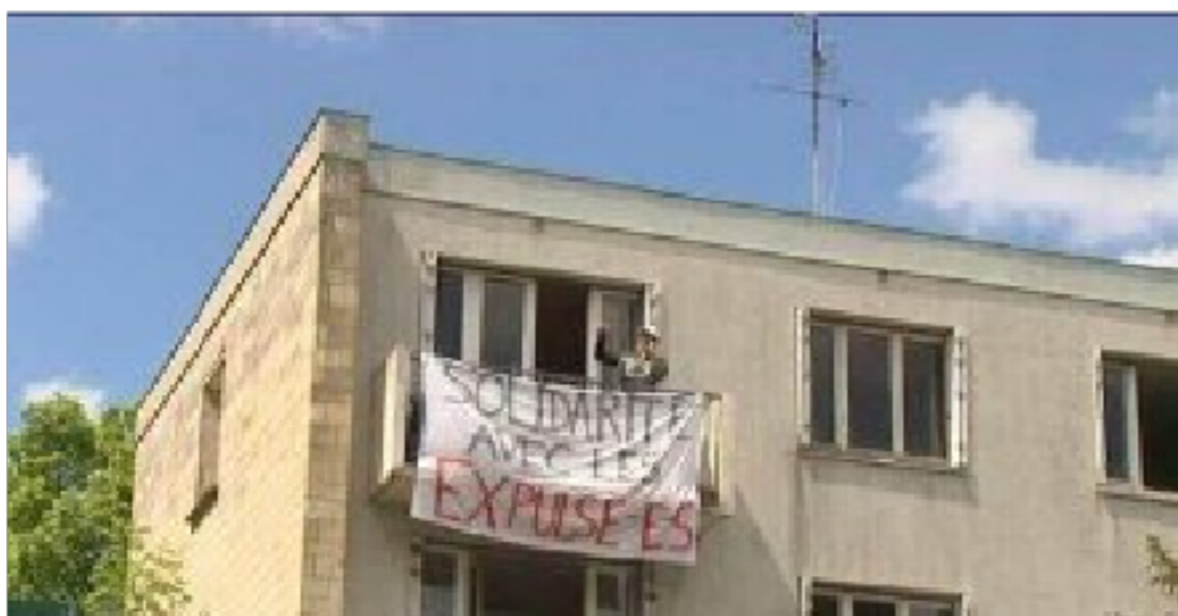
Solidaridad con todxs lxs expulsadxs

Solidaridad con todxs lxs expulsadxs [ en francés, se usa la misma palabra para desalojo y deportación ]